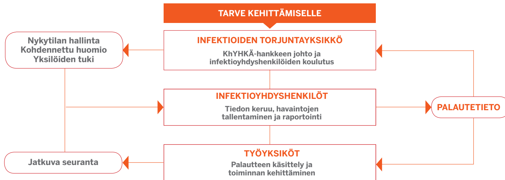
Kuvio 1: KhYHKÄ-toimintamalli